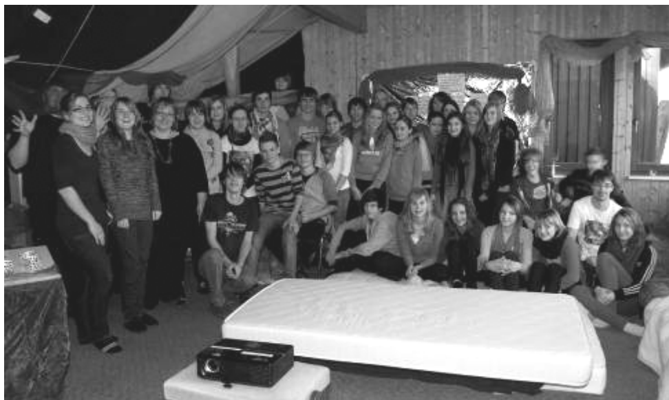
Konfirmanden-Freizeit 03. – 05.02.2012 in Ittlingen