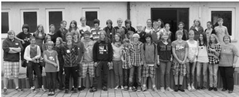
Konfis und Mitarbeiter

22 Jungen und Mädchen wurden zum Konfirmandenunterricht 2011/2012 angemeldet, und zwar aus